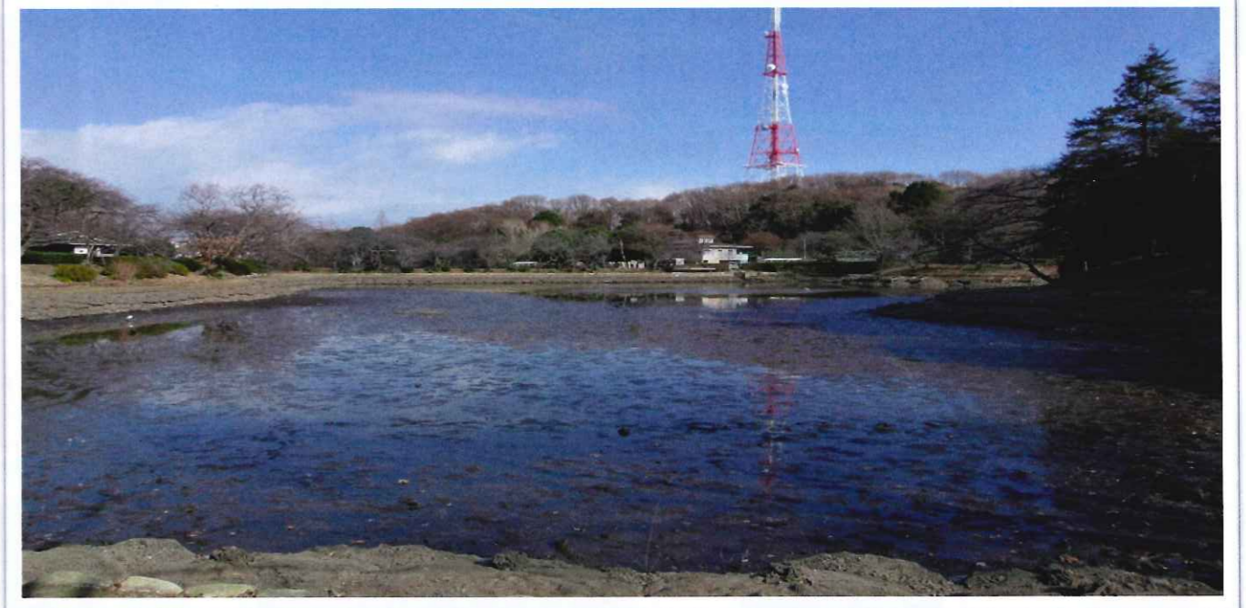
水抜きの完了した下の池

発行お問い合わせ先: 県立三ツ池公園管理事務所 指定管理者 横浜緑地・西武造園・協栄グループ