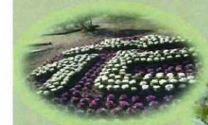
ハボタンの花文字 (花の広場)