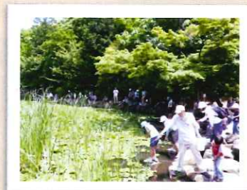
2010年 上の池、ザリガニ釣り