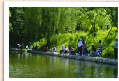
2011年 釣りによる防除