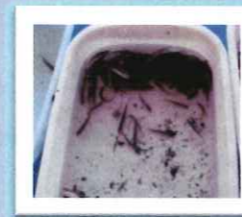
保護されたモツゴ（在来魚）