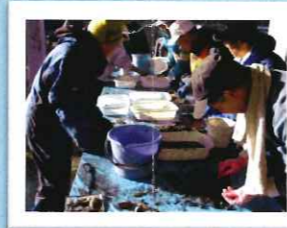
在来魚と外来魚の選別作業