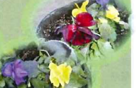
パンジー (パークセンター前)