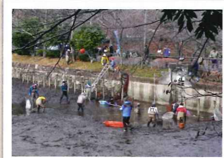
2008年 上の池、かい掘りの状況