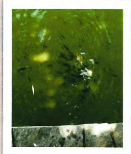
2006年 池の表面でブルーギルの大群を200匹以上見ることができました。