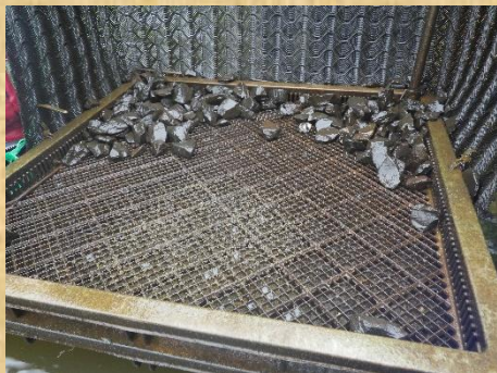
1か所の人工産卵床で、バスの卵が見つかりました。

今回はバスターズ22名がご参加下さいました。当日は曇天で日差しが弱く、風もほとんど吹かず快適に作業ができました。人工産卵床の見まわりでは、1か所でオオクチバスの卵が認められました。そのほか、底面の砂利を払った形跡もいくつかの産卵床で見つかりました。稚魚すくいでは、今回も単独または数匹の群れが岸際に点在していて、その都度すくい取りました。捕れた稚魚は体長20mmから35mmで、大きな個体と小さな個体の体格差がさらに広がっていました。定置網には、モツゴやタイリクバラタナゴ、テナガエビなどが入っていました。また、バス稚魚やブルーギルも捕獲・駆除されました。