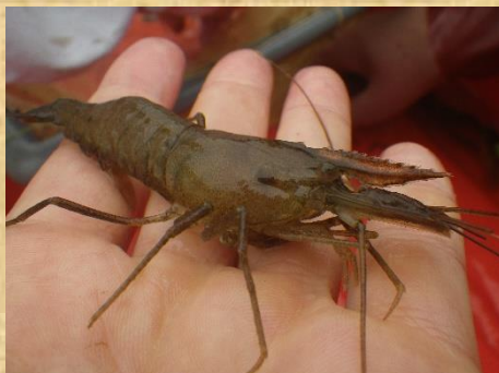
どの定置網にも、数匹のテナガエビが入っていました。