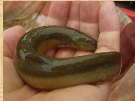
巨大なドジョウ。一見、ウナギとまちがえるほどでした。

次回のバスターズは、 6月26日(日) に行います。 みなさまのご参加お待ちしております！