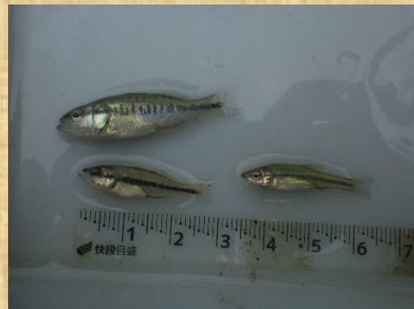
バス稚魚(左2匹)とモツゴ稚魚。並べると違いがよくわかります。