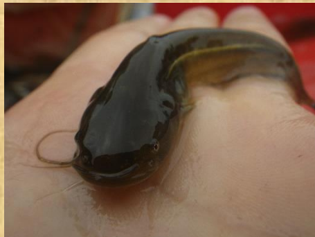
かわいらしいナマズの幼魚も捕れました。