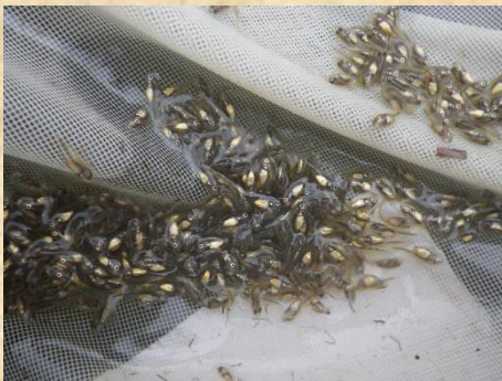
バスの稚魚が出始めました。まだ14mmくらいの大きさ。

第3回活動は波が高く作業が大変な日でしたが、17名のメンバーが来て下さいました。人工産卵床の見まわりでは、1か所でバスの産卵が認められたほか、4か所で底面の砂利を払った形跡が見つかりました。稚魚すくいでは、3か所でふ化して間もない稚魚の群れが採れました。また、ブルーギルの幼魚がぽつぽつと採れました。定置網の魚は、大物はバス、ライギョ、ナマズ、フナ、小型の魚はブルーギル、モツゴ、タモロコ、ヒガイ、タイリクバラタナゴ、コイ稚魚などが入っていました。また、モクズガニが多いことが印象的で、一つの定置網に6匹入っていたところもありました。