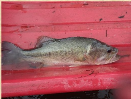
アイカゴで採れたバスの成魚。