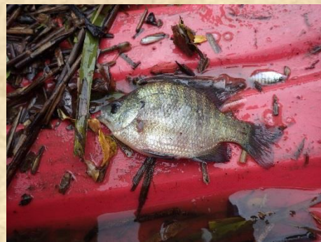
定置網に入った大きなブルーギル。腹に卵を持つ♀でした。