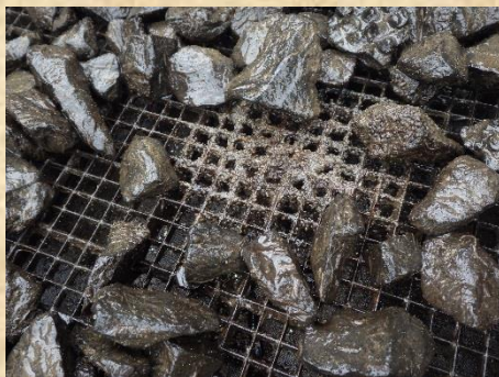
今回お騒がせだったのがこの物体。魚卵そっくりで紛らわしい。